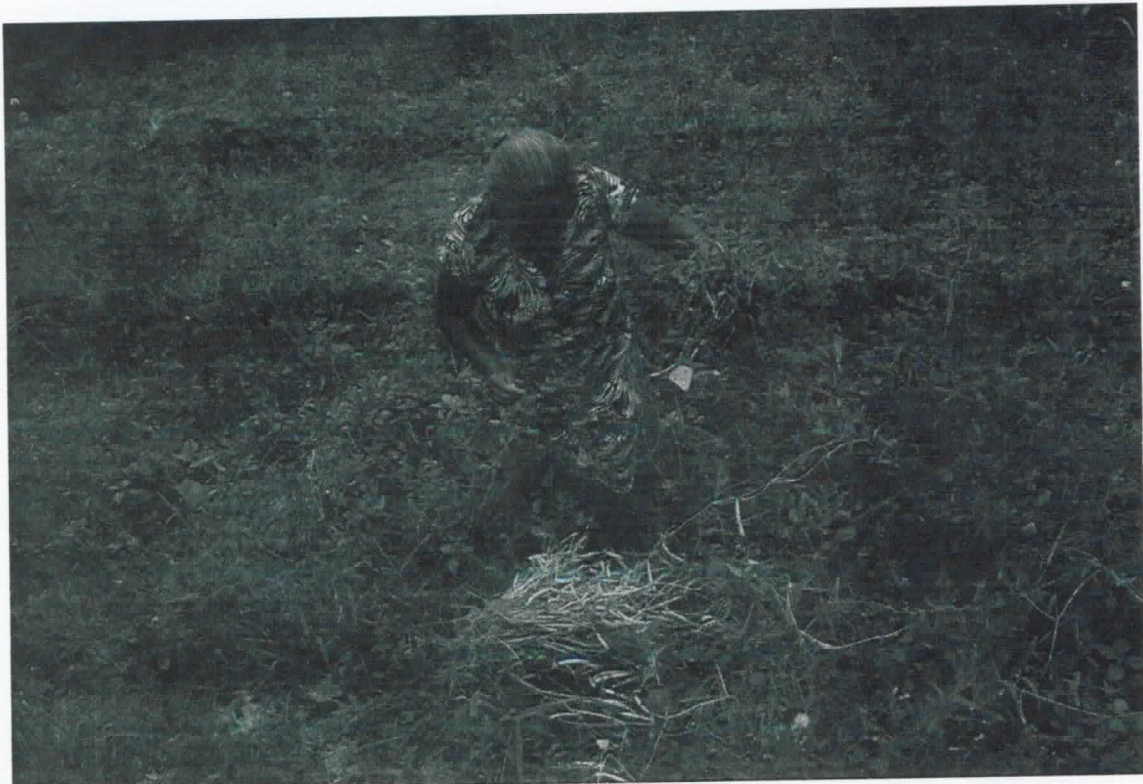
Acervo da comunidade

Handwritten signatures in blue ink, including a stylized signature at the top right and two circular signatures below it.