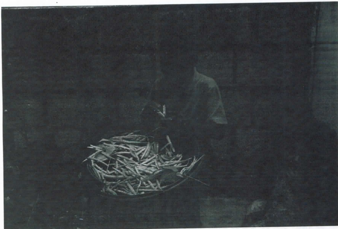
Acervo da comunidade.

INSERIR - (Links, Fotos, Vídeos, Recortes, etc.)